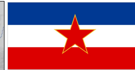
Jugoslovanska zastava in grb