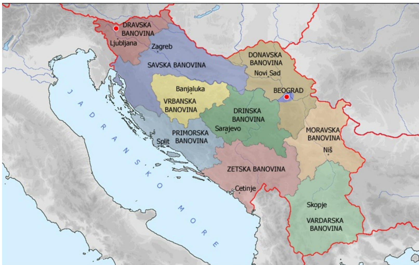
Jugoslovanske banovine z glavnimi mesti