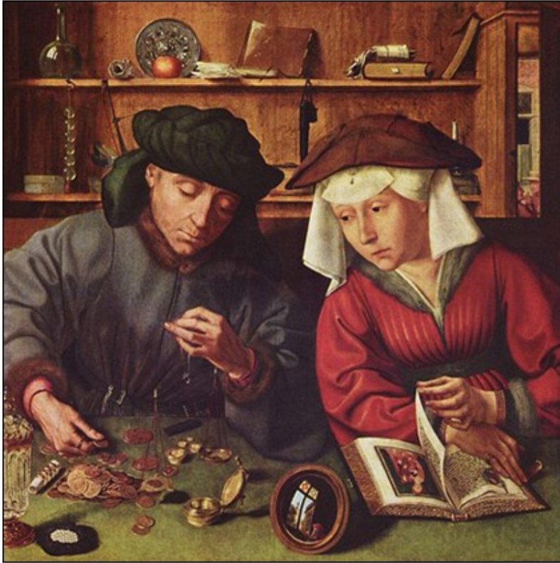
Bankir in njegova žena (slika flamskega slikarja Quentina Massysa, naslikana leta 1514).

Kdor koli, ki je imel opravka z denarjem se je kmalu znašel pred oviro. V obtoku je bilo veliko število različnih kovancev različnih vrednosti.