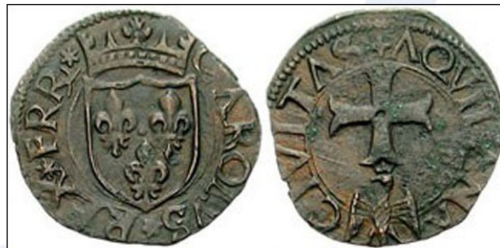
Neapeljski bronasti kovanec izdelan ob koncu 15. stoletja.

Vedno večja količina denarja v obtoku je omogočila prevlado blagovno-denarne menjave nad preprostejšo blagovno menjavo.