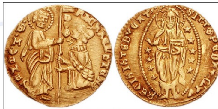
Beneški zlatnik izdelan ob koncu 14. stoletja.

V zgodnjem srednjem veku je bila pravica kovanja denarja privilegij vladarjev. Številni višji fevdalci in predstavniki cerkve so želeli pravico do kovanja svojega denarja, zaradi česar so jim vladarji dopustili izgradnjo svojih kovnic . Ko se je razmahnilo kovanje denarja, je prišlo v obtok veliko različnih novcev, ki so bili različne vrednosti. Zaradi tega so nekateri trgovci, predvsem Judi, odprli menjalnice , v katerih so tujim trgovcem ponujali zamenjavo tujih novcev za domače, s čimer so jim olajšali trgovanje (in tudi sami nekaj zaslužili z menjavo).