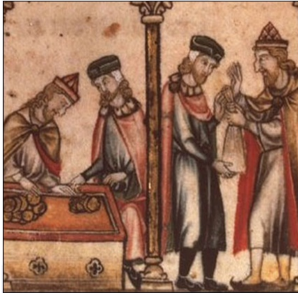
Židovski bankirji (upodobljeni z dolgimi kjukastimi nosovi) posojajo denar trgovcem.