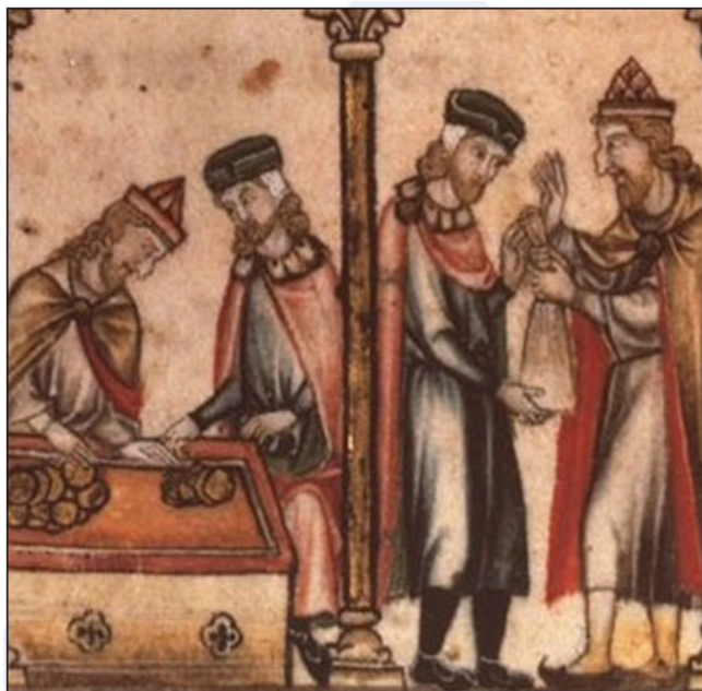
Židovski bankirji (upodobljeni z dolgimi kljukastimi nosovi) posojajo denar trgovcem.

Bančništvo in posojanje denarja za obresti je bil v začetku dovoljen le nekristjanom. V evropskih srednjeveških mestih so to delo opravljali Judje.