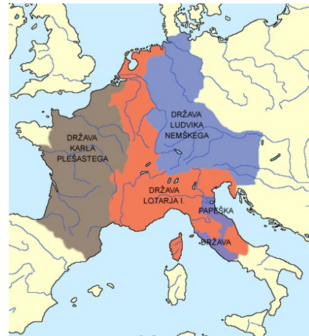
Razdelitev frankovske države po smrti Karla Velikega

Po smrti Karla Velikega je vzhodni del države dobil Ludvik Nemški