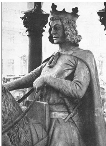
Oton I. Veliki (912 - 973), ustanovitelj rimsko-nemškega cesarstva.

Sredi 10. stoletja je državo pred Madžari obranil kralj Oton, ki ga je papež leta 962 okronal za cesarja Rimsko-nemškega cesarstva (Sveto Rimsko-nemško cesarstvo).