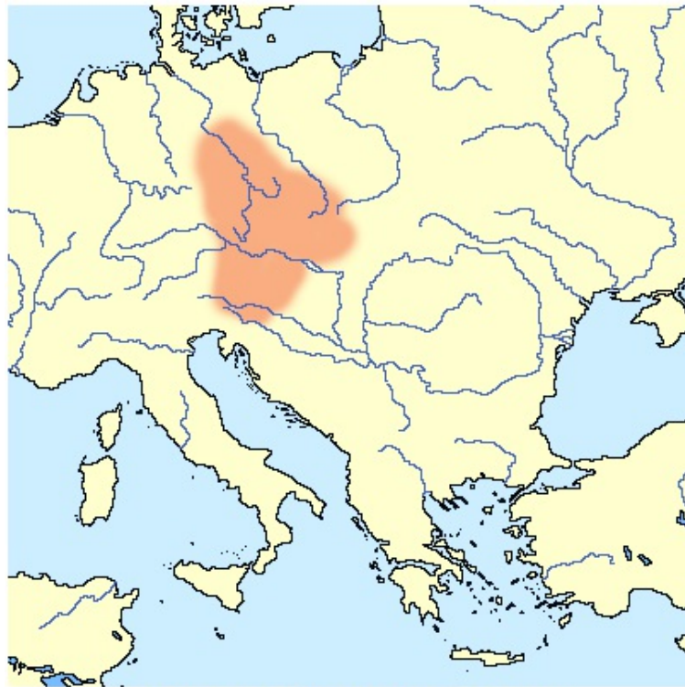
Približen obseg Samove plemenske zveze