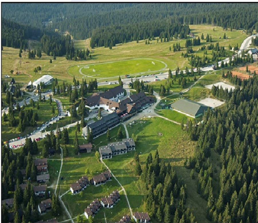
Rogla je zelo priljubljena med rekreativci, kakor tudi med športniki kot območje za izvajanje višinskih priprav.