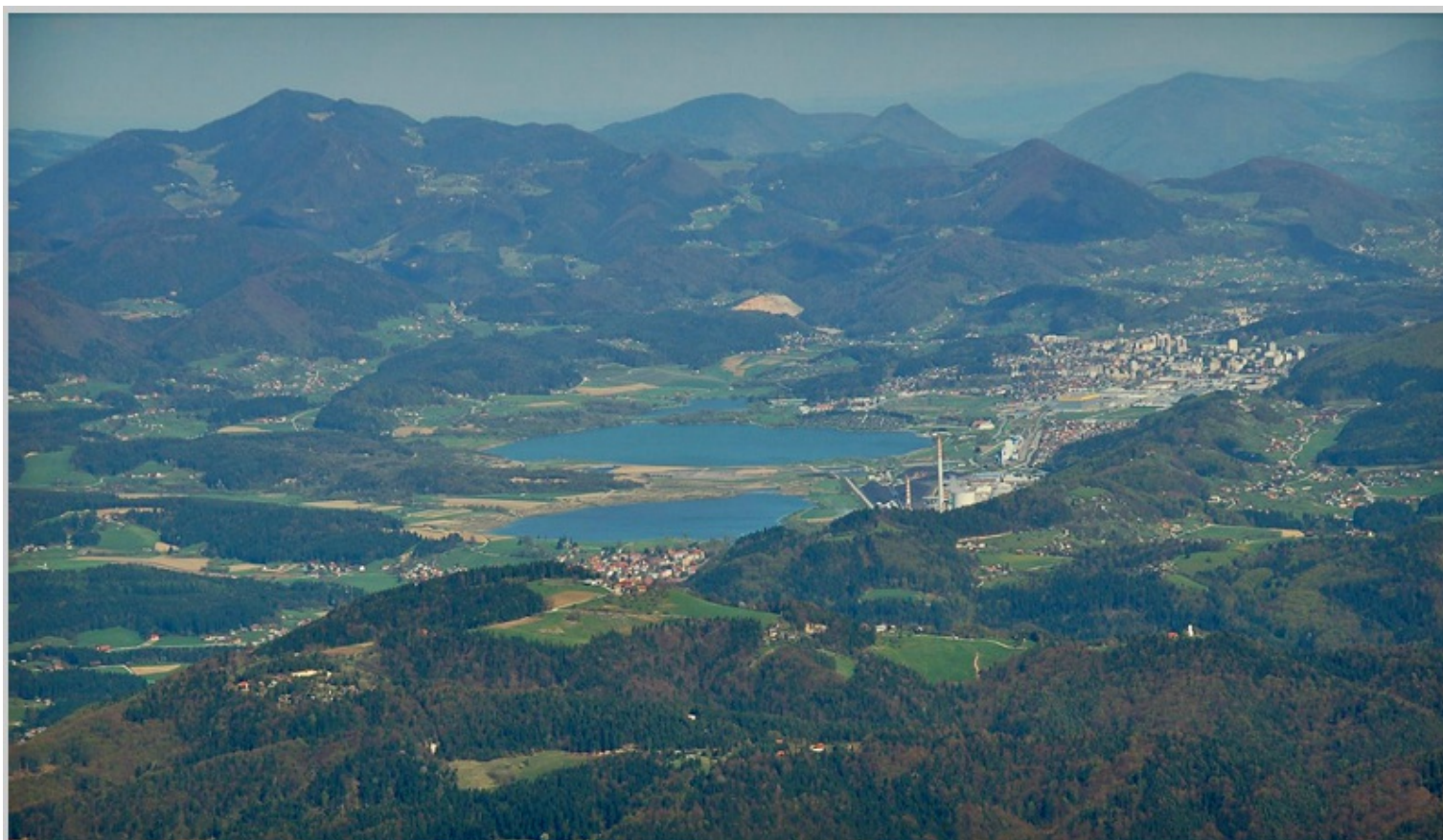
Velenjska kotlina; v osrednjem delu fotografije Šoštanj in Velenjsko jezero, v ospredju TE Šoštanj, desno zadaj Velenje