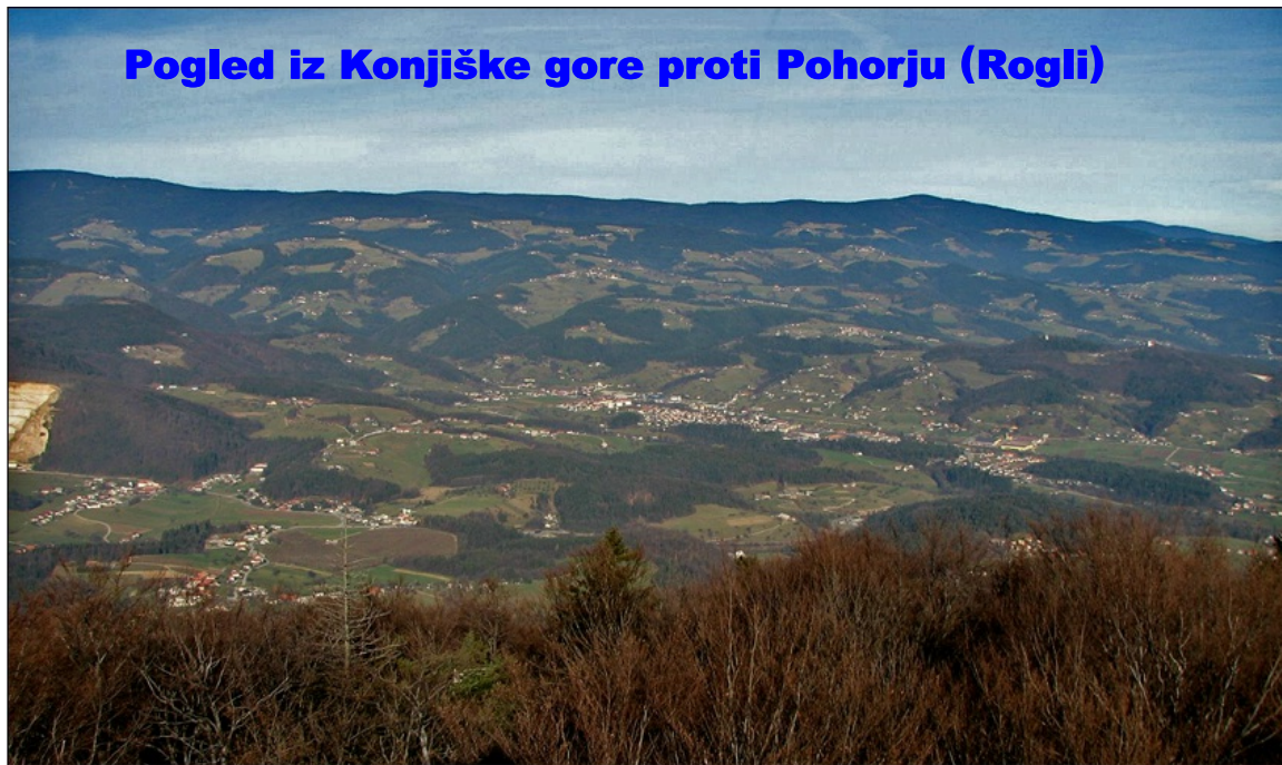
Pogled iz Konjiške gore proti Pohorju (Rogli)

S pomočjo besedila in zemljevida v učbeniku (str. 107) razloži kamninsko zgradbo Pohorskega podravja.