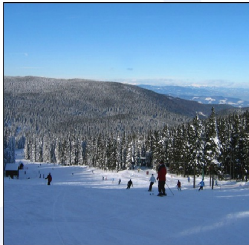
Smučarske proge na Rogli

Najpomembnejše gospodarske panoge v hribovju so turizem, živinoreja in gozdarstvo.