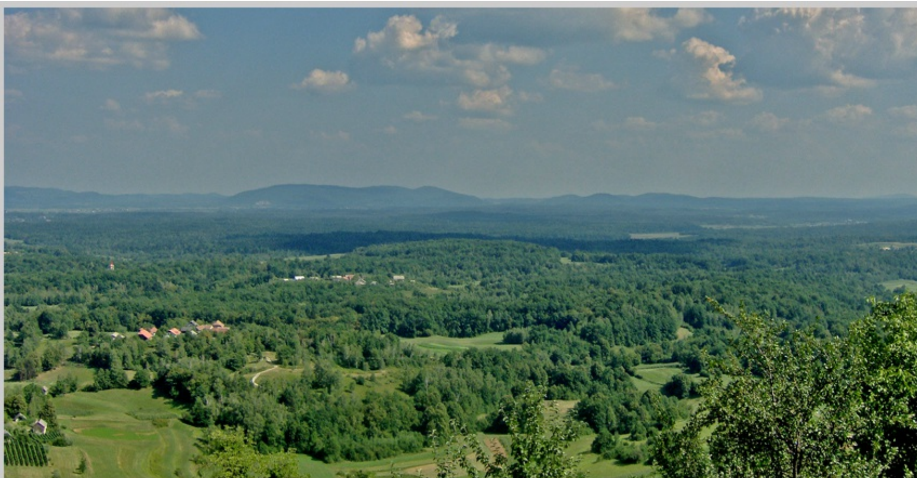
Primer kraškega ravnika (Bela krajina)

S pomočjo zemljevida oceni nadmorsko višino belokranjskega kraškega ravnika.