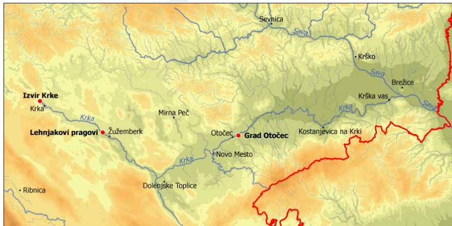
Od izvira Krke do njenega izliva v Savo

Krka je približno 94 km dolga reka, ki v celoti teče po slovenskem ozemlju. Takoj za Savinjo (96 km) je Krka druga najdaljša reka, ki teče izključno na slovenskem ozemlju. Njen izvir je na nadmorski višini 268 m, njen izliv v Savo pri Brežicah pa na nadmorski višini 139 m. S povprečnim strmecem 1,2 % je ena naših najbolj umirjenih rek, sicer pa je do Novega mesta strmec večji, nizvodno pa nižji. Porečje obsega 2.284 km 2 , kar je več kot desetina slovenskega ozemlja.