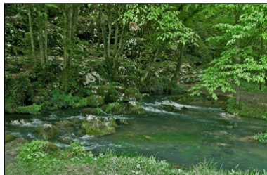
Krka v bližini izvira

Krka izvira pod Krško jamo, v bližini naselja Krka. Neposredno iz jame izvira Krka le ob povodnji. Že v srednjem veku je lokalno prebivalstvo poznalo to jamo in se v času turških vpadov skrilo vanjo. O tem govori tudi Jurčičeva povest Jurij Kozjak. Prvi, ki je zabeležil svoj obisk Krške jame, je bil Valvasor v 17. stoletju. V Krški jami so že sredi 19. stoletja našli človeške ribice, kar je ena zgodnejših znanih nahajališč človeške ribice. Glavni vhod v jamo so leta 1935 razširili, da bi omogočili hitrejši odtok podzemne vode in razrešili problem poplav na Radenskem polju. Jama je dolga približno 200 m in široka okoli 30 m. Od leta 1996 je jama urejena za obiske, a si jo je možno ogledati le v spremstvu turističnega vodiča.