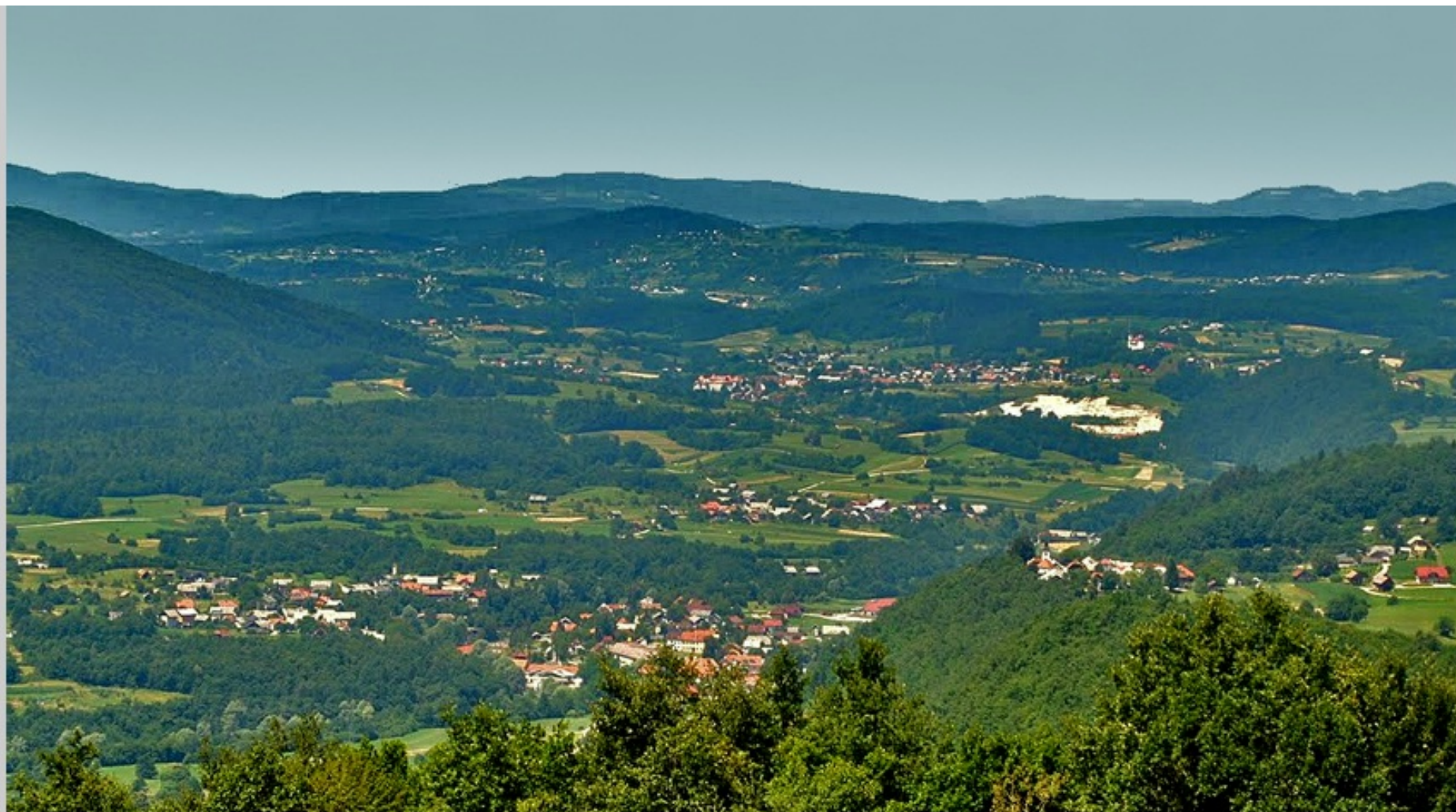
Primer nizke dinarske pokrajine: rahlo valovit relief, ki nekoliko spominja na gričevje (dolina Krke)