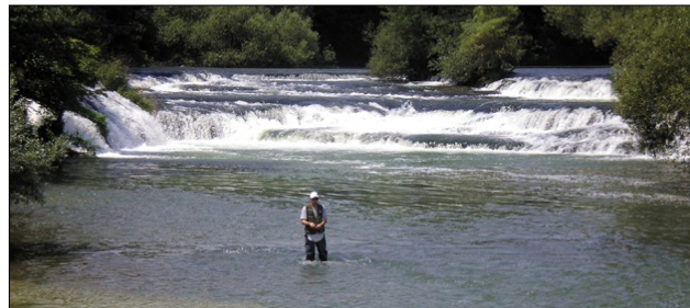
Lehnjakovi pragovi nad Žužemberkom

Krka teče po eni najbolj kraških območij v Sloveniji, zaradi česar ima njena voda visoke koncentracije kalcijevega karbonata. Iz vode izločen kalcijev karbonat tvori značilne lehnjakove pragove in naravne jezove. V zgornjem toku lehnjak tvori značilne pregrade, v srednjem pa talne podvodne pragove. Krka je naša edina lehnjakotvorna reka.