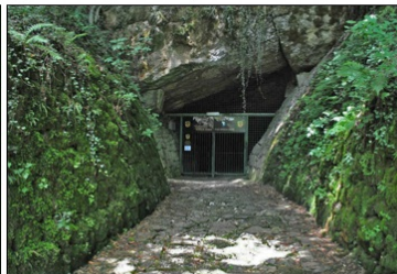
Vhod v Krško jamo