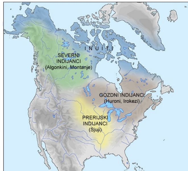
Največje skupine indijanskih plemen in njihova poselitvena območja pred prihodom Evropejcev

Preberi besedilo v učbeniku na strani 64 in odgovori na vprašanja.