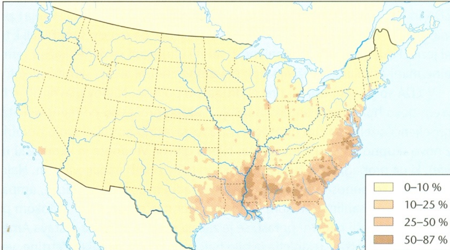
Prostorska razporeditev črnega prebivalstva v ZDA