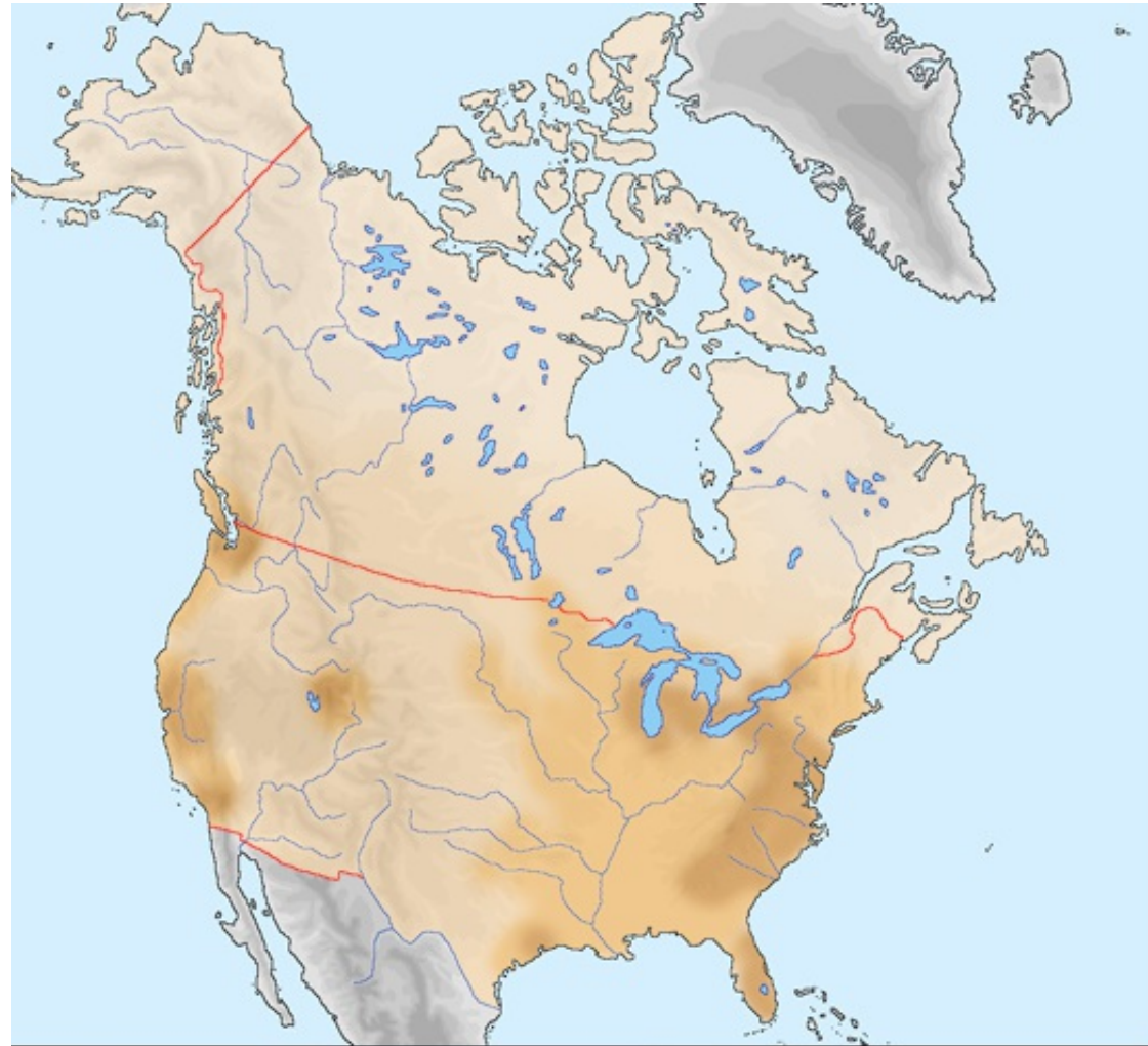
Zgostitvena območja prebivalstva Severne Amerike

Oglej si zemljevid in pojasni zgostitvena območja Severne Amerike glede na naravne dejavnike. Upoštevaj značilnosti reliefa, podnebja in rastja.