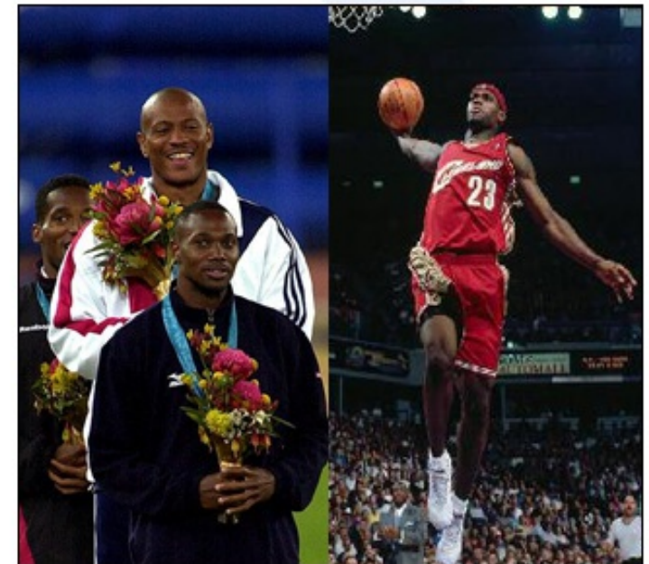
Črnci so zelo uspešni športniki (atletika na 100 m; košarka NBA)