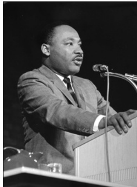
Borec za pravice črnega prebivalstva Martin Luther King (1929 - 1968)