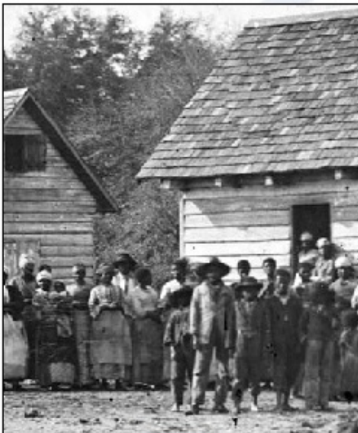
Suženjstvo je bilo v ZDA prepovedano šele po državljanski vojni, v letu 1865

Predvsem črno prebivalstvo je bilo zaradi zgodovine zmeraj zapostavljeno: čeprav je bilo suženjstvo odpravljeno leta 1862, so bili afroameričani obravnavani kot drugorazredni državljani. Kljub temu, da je bilo rasno razlikovanje z zakonom odpravljeno v 60-ih letih 20. stoletja, pa se socialne razlike med belim in črnim prebivalstvom še vedno kažejo v večjih mestih, kjer v getih živi predvsem črno prebivalstvo. V getih živi tudi veliko hispanoameričanov, vendar je problem manjši, saj ni obremenjenosti s preteklo suženjsko zgodovino in storjenimi krivicami.