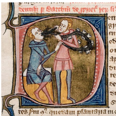
Srednjeveška inicialka, 13. stol.