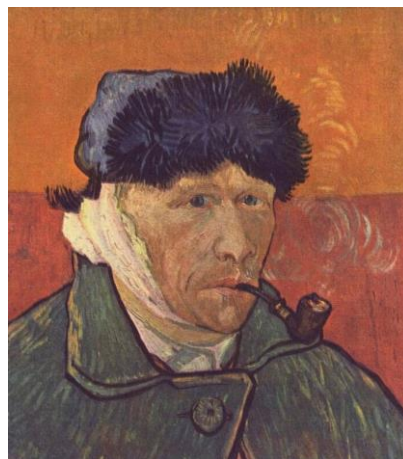
Van Gogh, Avtoportret