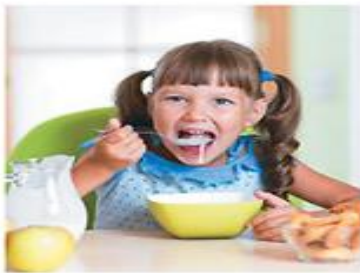
Jej večkrat na dan. Hrana naj bo raznovrstna.

Zdravje zelo močno vpliva na tvoj razvoj, počutje in delo. Za zdravje si moraš prizadevati z zdravim načinom življenja. Jej raznoliko in zdravo hrano, skrbi za osebno čistočo ter varnost. Veliko se gibaj na svežem zraku in dovolj počivaj. Vzemi si čas za stvari, ki so ti všeč.