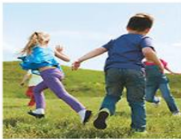
Pojdi ven in se čim več gibaj in igraji.