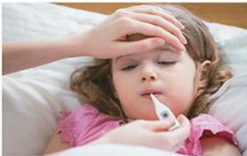
Kadar zbolimo, potrebujemo veliko počitka. O zdravljenju se posvetujmo z zdravnikom.

Ko zboliš, moraš počivati. Včasih je potrebno obiskati zdravnika, ki te pregleda in ugotovi, kako je treba bolezen zdraviti. Pri resnejših obolenjih in zapletih pri zdravljenju te lahko zdravnik napoti na zdravljenje v bolnišnico.