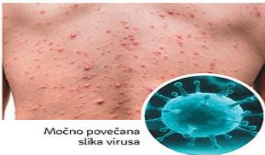
Močno povečana slika virusa

Norice ali vodene koze so nalezljiva bolezen, ki jo povzroča virus.