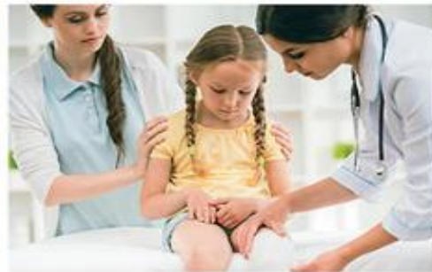
Zdravnika je potrebno obiskati pri vseh resnejših poškodbah (ureznine, zvini, zlomi ...).