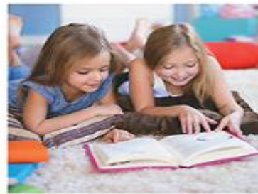
Ne pozabi na druženje in svoje konjičke.