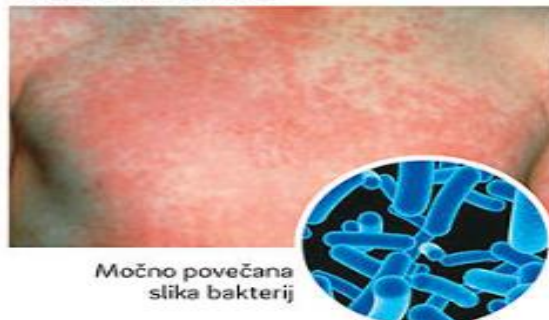
Močno povečana slika bakterij

Škrlatinka je nalezljiva otroška bolezen, ki jo povzroča bakterija.